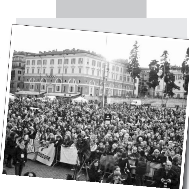
11 Aralık 2011 | İtalya

Avrupa'nın Akdeniz Havzası odaklı sınıf ve kitle hareketinin yarattığı enerjinin, AB'nin merkez ülkelerinde büyük salınım yaratması kaçınılmazdır. 2012 yılında özellikle Yunanistan ve İtalya'da sınıf mücadelesinin yoğunlaşması beklenmelidir. Yunanistan ve İtalyan işçi sınıfının, yaratacağı pratiklerle Avrupa işçi sınıfı üzerindeki ataleti kırması muhtemeldir.