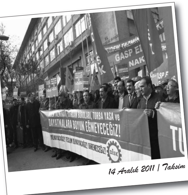
14 Aralık 2011 | Taksim